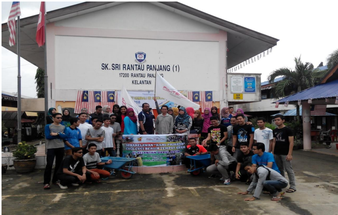
Peserta dan penyelaras Program Khidmat Masyarakat Pasca Banjir di Kelantan bergambar bersama setelah selesai gotong-royong di Sk. Sri Rantau Panjang (1)