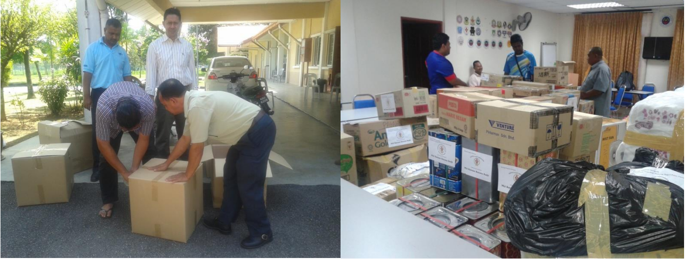
Beberapa orang staf PSP menguruskan barangan keperluan untuk dihantar ke lokasi yang terjejas