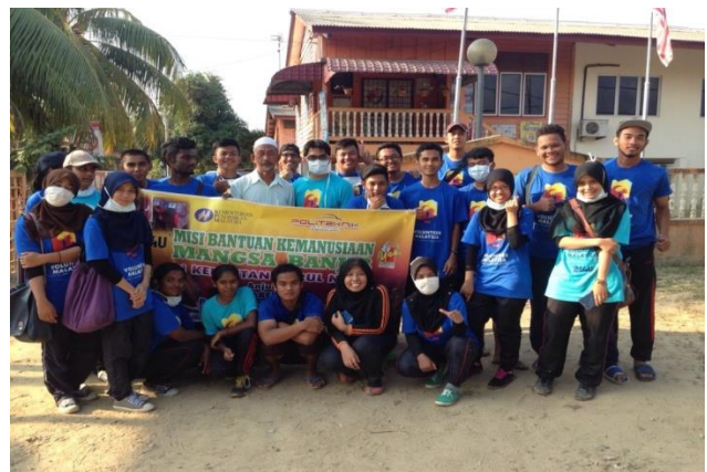
Semua peserta dan penyelaras Program Khidmat Masyarakat Pasca Banjir di Kelantan bergambar bersama di Kampung Laut, Kelantan