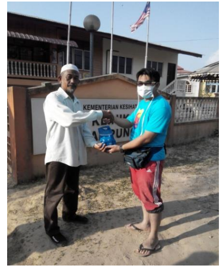
Penyerahan sumbangan kewangan warga Politeknik Seberang Perai oleh Penyelaras Program kepada Penghulu Kampung