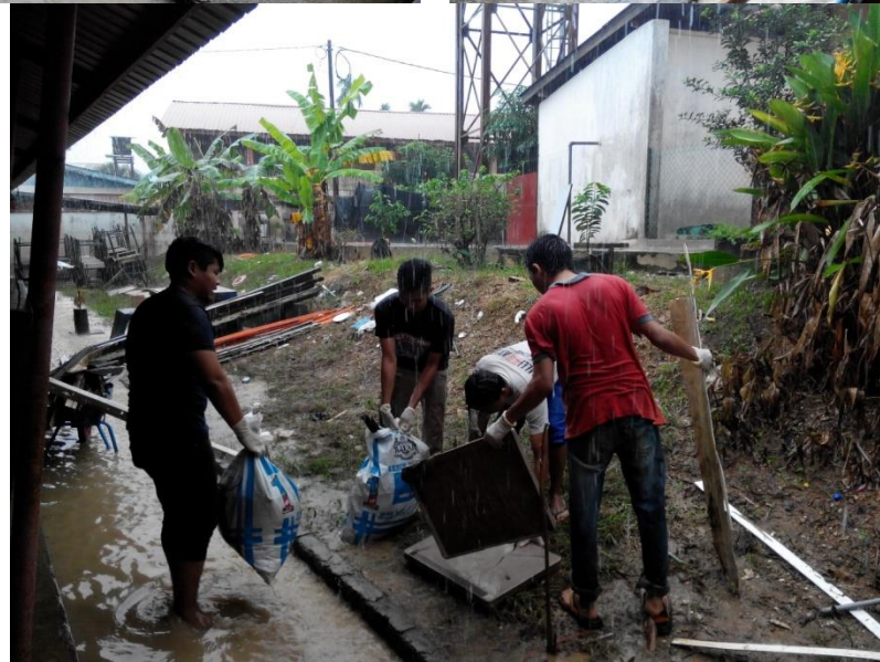
Para sukarelawan bertungkus-lumus membersihkan kawasan yang terjejas.