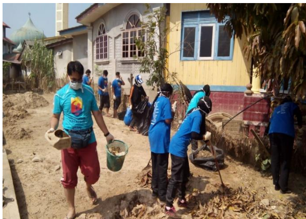
Para peserta mengutip sampah sarap di luar perkarangan kawasan Klinik Desa Kampung Laut, Kelantan